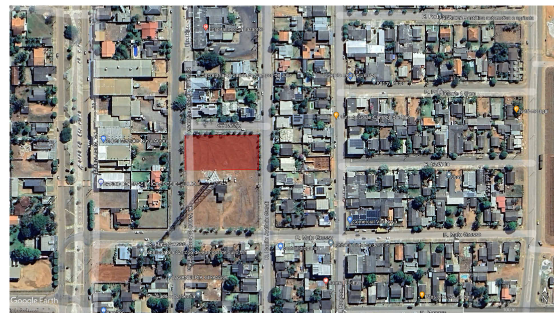
4 Local da Construção